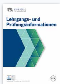
Lehrgangs- und Prüfungsinformationen