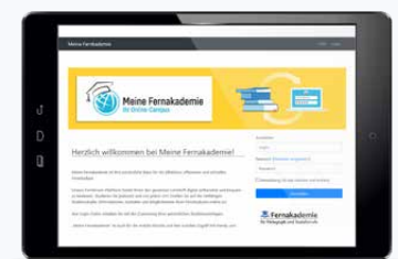
Persönlicher Zugang zum Online-Lernportal „Meine Fernakademie“

Nach der Anmeldung erhalten Sie von uns, je nach Fernkurs, ein oder mehrere Lehrheft/e mit allen prüfungsrelevanten Informationen. Zusätzlich erhalten Sie Ihre persönlichen Login-Daten für das Prüfungsportal www.meine-fernakademie.de . Dort haben Sie dann nach dem Studium der prüfungsrelevanten Unterlagen die Möglichkeit, die Prüfungsfragen online zu beantworten.