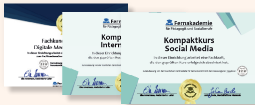
3 Aufkleber für den Eingangsbereich