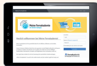
Persönlicher Zugang zum Online-Lern-Portal „Meine Fernakademie“