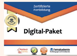
1 Schild zur Qualitätsauszeichnung für die Einrichtung