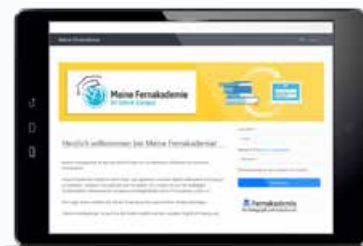
Persönlicher Zugang zum Online-Lern-Portal „Meine Fernakademie“