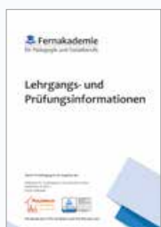
Lehrgangs- und Prüfungsinformation