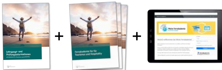
Gedruckte Unterlagen: Lehrgangs- und Prüfungsinformation + 6 Lehrgangshefte + Persönlicher Zugang zum Online-Lern-Portal „Meine Fernakademie“