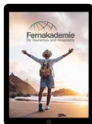
Digitalpaket: inkl. iPad

Digitalpaket inkl. iPad oder klassisch mit gedruckten Unterlagen