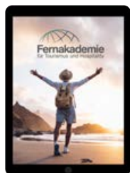
Digitalpaket: inkl. iPad

Digitalpaket inkl. iPad oder klassisch mit gedruckten Unterlagen